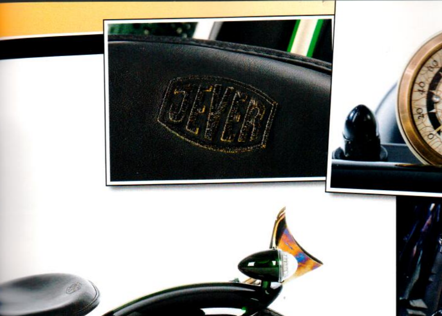
Alt oder auf alt getrimmt: Der ehe malige Traktorsitz ist mit Leder bezogen, der Tacho von motogadget passt zum Stil und der seitlich montierte Benzinkanister dient nur als Ölreservoir