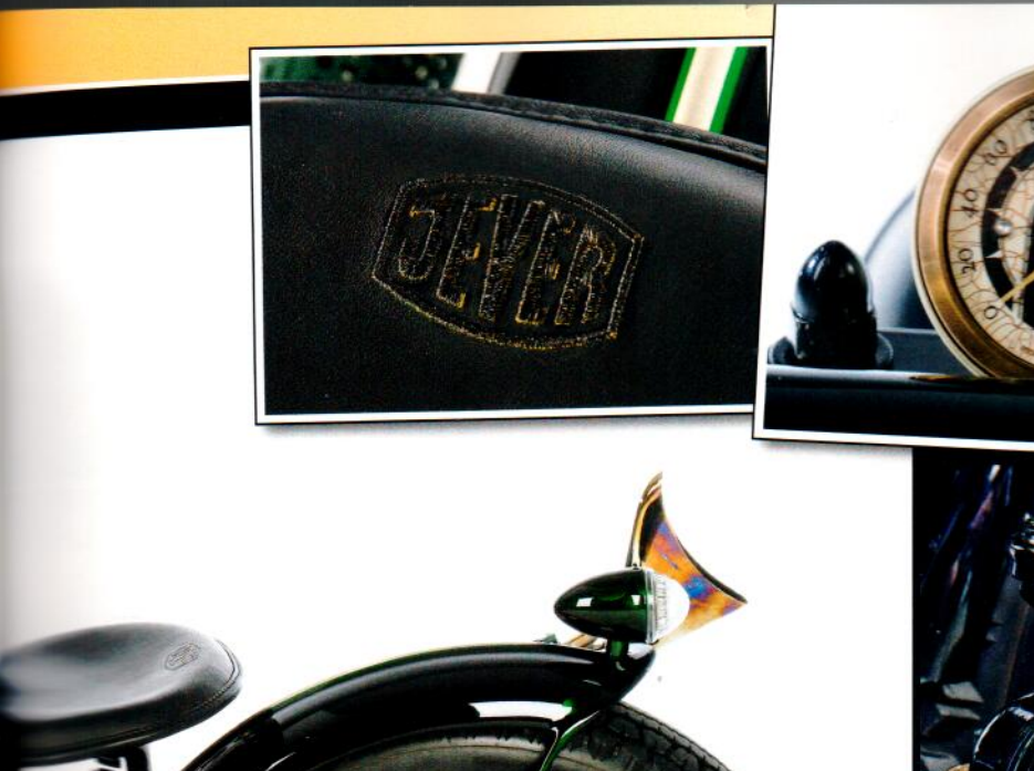
Alt oder auf alt getrimmt: Der ehe malige Traktorsitz ist mit Leder bezogen, der Tacho von motogadget passt zum Stil und der seitlich montierte Benzinkanister dient num als Ölreservoir